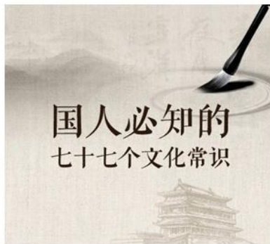
本文选录，详细资料请查阅：人民网

李宝嘉《官场现形记》 吴沃尧《二十年目睹之怪现状》 刘鹗《老残游记》 曾朴《孽海花》